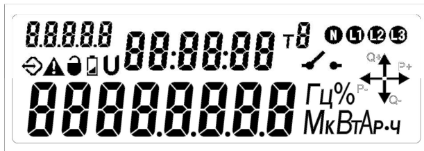
Рисунок 2 Общий вид ЖКИ