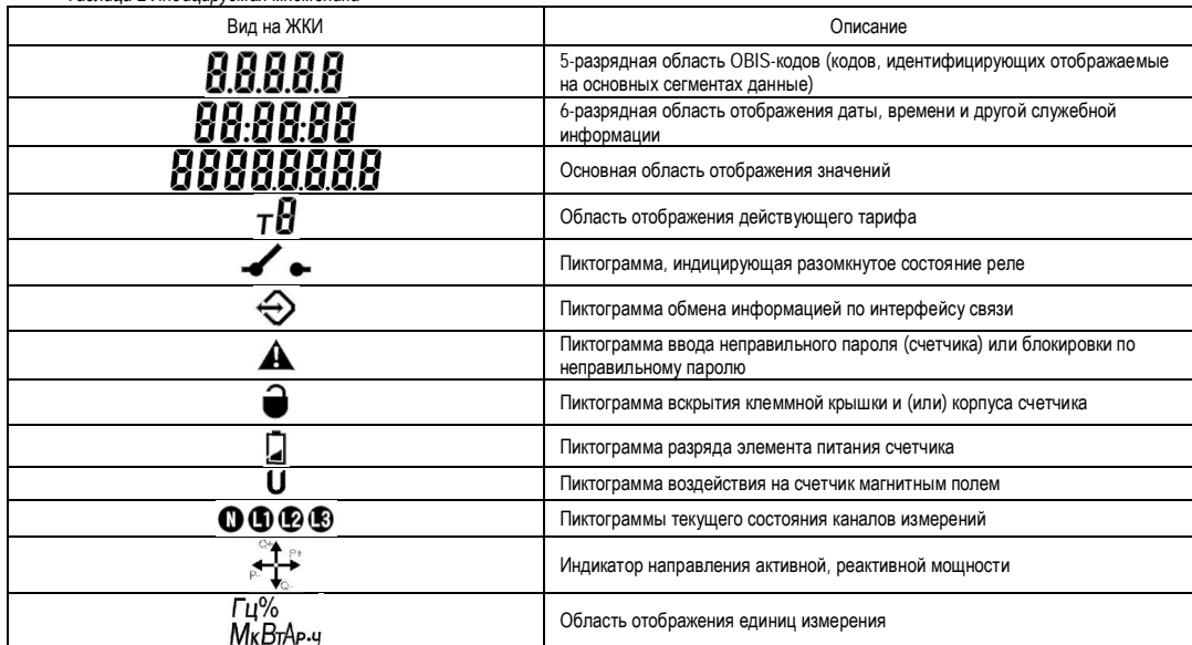
Таблица 2 Индицируемая мнемоника

Форматы вывода измеренных, вычисленных и накопленных параметров счетчика приведены в таблице ниже.